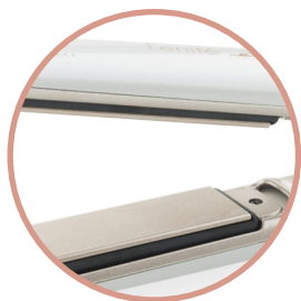
Odpružené destičky pro perfektní přilnutí k vlasům