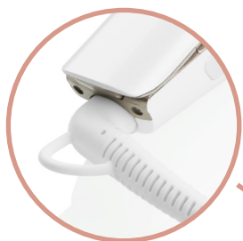
Otočný napájecí kabel s poutkem na zavěšení