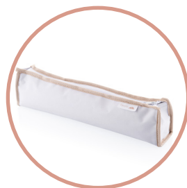
Ochranné cestovní pouzdro